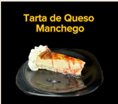
Tarta de Queso Manchego