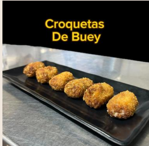
Croquetas De Buey

Hamburguesa de buey con queso cheddar y bacon bien tostado sobre una capa de Crema de cacahuete y con un topping de mermelada de fresa acompañada de nuestro pan brioche NEGRO . 12€