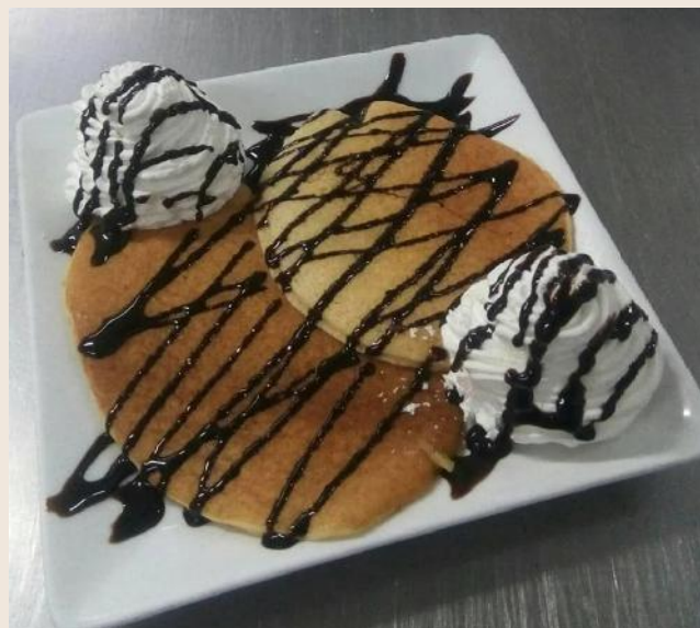
Tortitas con Nata y sirope de chocolate

Culant de chocolate con helado de vainilla, nata y sirope de chocolate. 6€