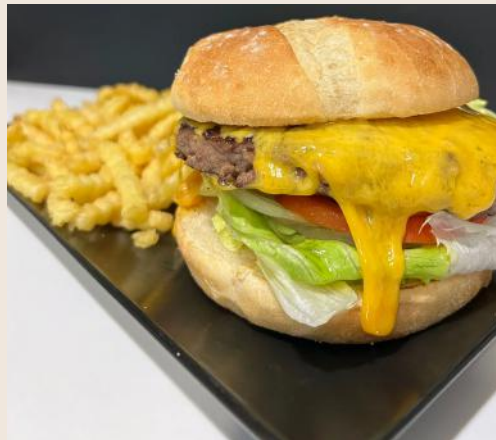
Hamburguesa de Buey