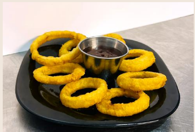
Aros de Cebolla