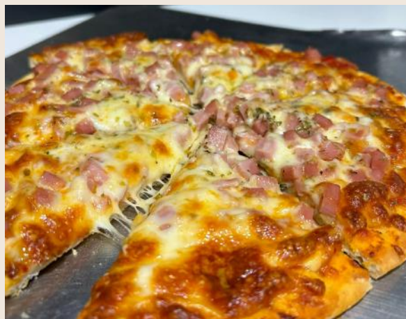
Pizza de Jamón y Bacon