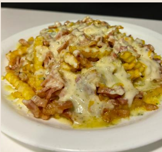
Patatas Chesee Bacon

Patatas fritas con 3 tipos diferentes de queso fundido y picadillo de ciervo. Tamaño mediano 6€/Tamaño completo 10€