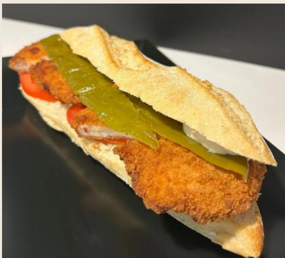
Chapata de pollo y pimiento